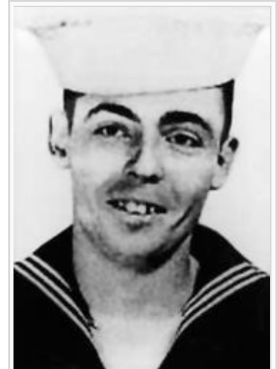
Thomas Pynchon (um 1957)