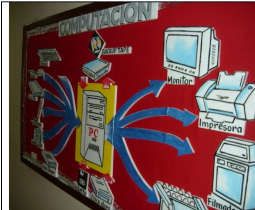
Mural de la carrera