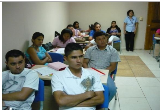
Otro ángulo de la reunión con estudiantes de Educación - materia Informática.