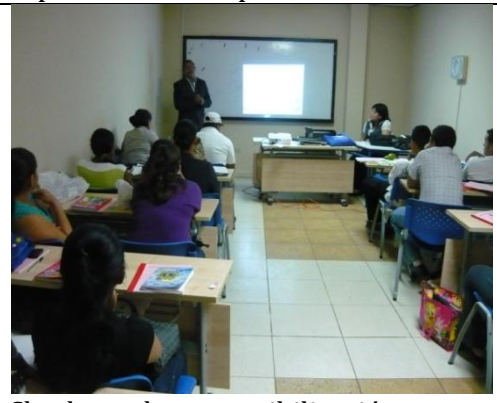
Charla de sensibilización con estudiantes de la carrera de educación.