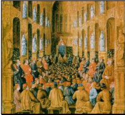
El papa Urbano II predicando la primera cruzada

Se denominaron cruzadas a las acciones militares llevadas a cabo por los países católicos como respuesta al avance turco. Si bien durante el siglo VII los musulmanes extendieron sus dominios en Europa, la llegada de los turcos se caracterizó por su fanatismo religioso .