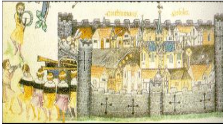
Toma de Constantinopla durante la Cuarta Cruzada

Entre los años 1207 y 1270 se produjeron otras cuatro cruzadas. Ninguna de ellas tuvo éxito y hacia fines del siglo XIII los turcos habían recuperado casi la totalidad de las posesiones en disputa. A pesar de ello, los turcos se mantuvieron a la defensiva durante dos siglos, lo que permitió a los bizantinos poder mantenerse al frente de sus territorios hasta el año 1453.