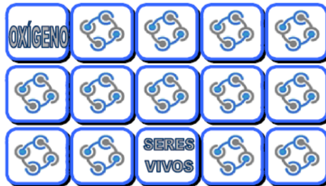
Figura 1: Ejemplo de barajas.

En el ejemplo anterior se voltearon dos recuadros, uno tiene el concepto “Oxígeno” y el otro “Seres Vivos”, y el jugador debe relacionarlos por medio de una palabra de enlace o frase de enlace.