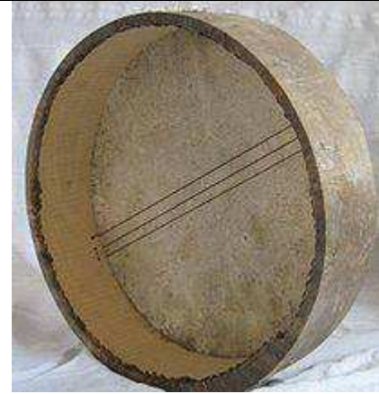
Tamburo a cornice