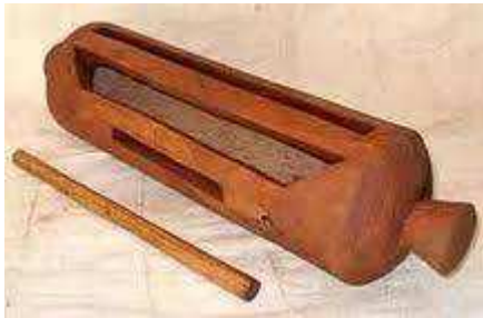
Tamburo a fessura