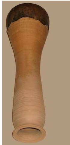
Tamburo a calice