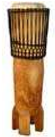
Tamburo a barile