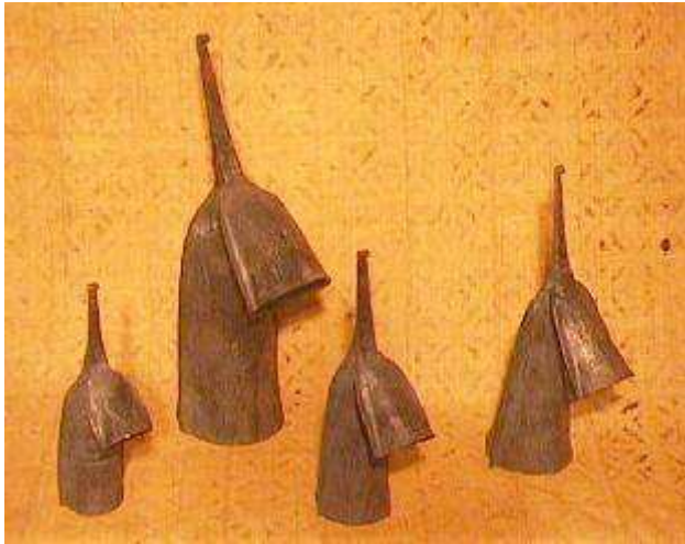
Doppia Campana SLIT DRUM (Congo)