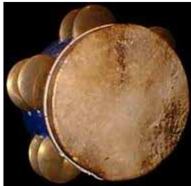
Tamburo a cornice