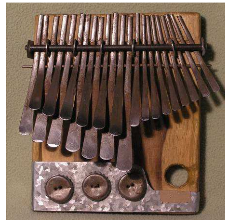
Piano a pollice