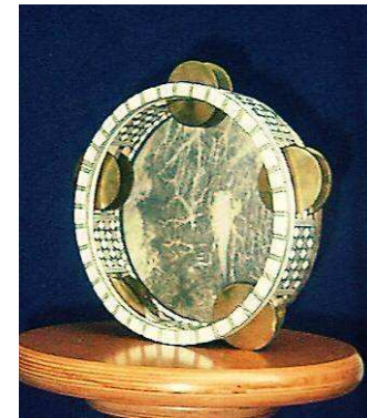
Tamburo a cornice