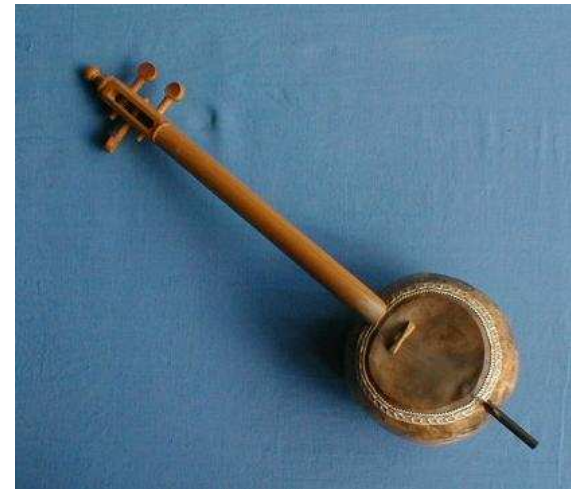
Fidula ad arco