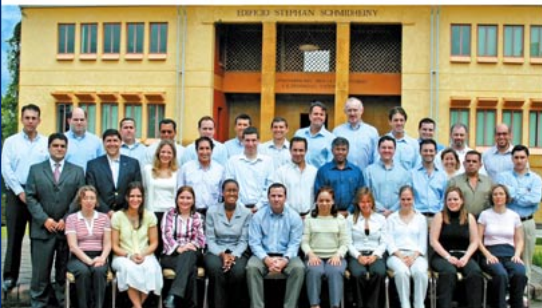
> Grupo Coca-Cola Latin Center Division, noviembre 2005

El seminario me permitió conocer mejor mi manera de negociar actual y como actuar ante diferentes conflictos que se me presentan. Adicionalmente incorpore y aprendí teoría de la negociación y cómo comportarme para contribuir a generar acuerdos. Los profesores fueron los máximos responsables de esto. La metodología es excelente con una alta participación de los estudiantes donde siempre todos participan.